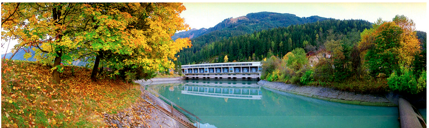
VERBUND-Laufwasserkraftwerk Mayerhofen, Zillertal